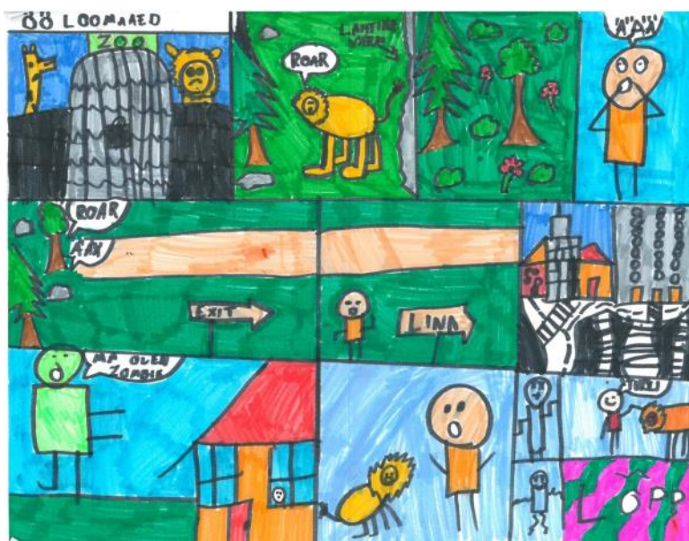
Autor: Tristan Mäeväli